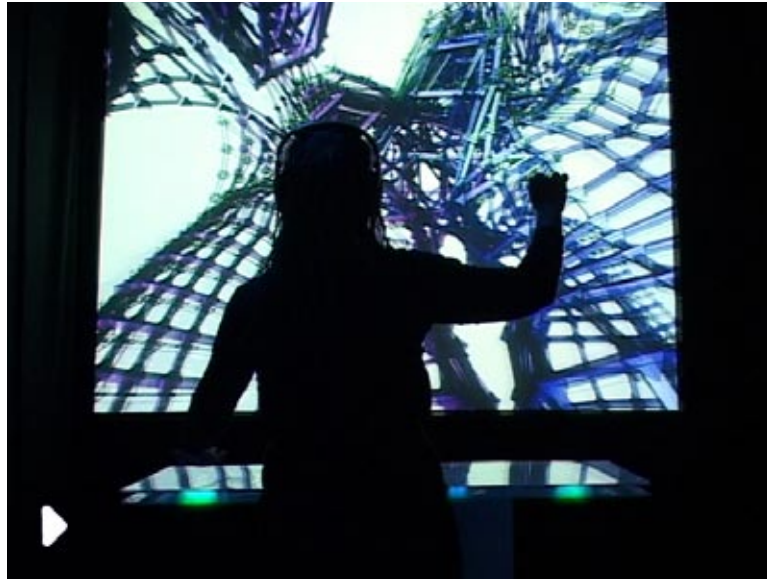
Vain in transit: digital creature, 2005. Instalación multiusuario con tecnología EFS. V2_, Institute for the unstable media, Rotterdam.

fuera así, cada ser pensante y cada forma existiría en su propia perfección, completamente independiente del espacio. Esta concepción se encuentra en la dualidad mente/cuerpo de Descartes y adquiere carácter operativo en la representación de la realidad.