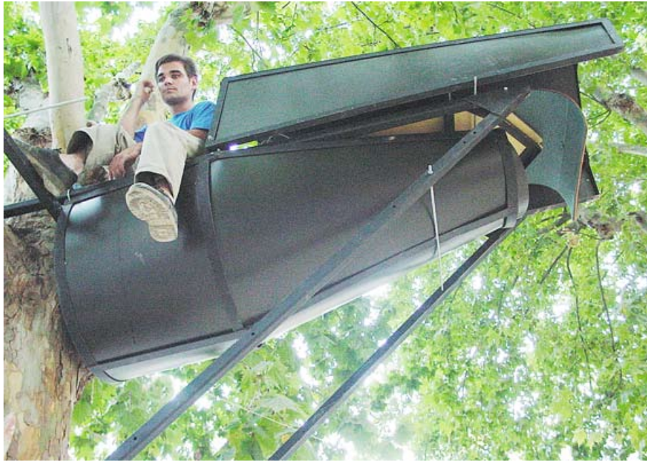
Ocupación de árboles con casa-insecto, Sevilla, 2001

desmontables, como si de objetos almacenados en solares desocupados se tratasen, y que no deterioran las condiciones del solar en el que están alojados. De esta manera, y esquivando las leyes del PGOU, Cirujeda consigue “construir” una casa-estudio en Sevilla durante un año y un mes, y un centro social en Madrid —que aún sigue en pie— con materiales más o menos precarios y más o menos ingeniosos —casetones recuperables para forjados en lugar de paredes, estructuras estabilizadoras de fachada como estructura principal...—.